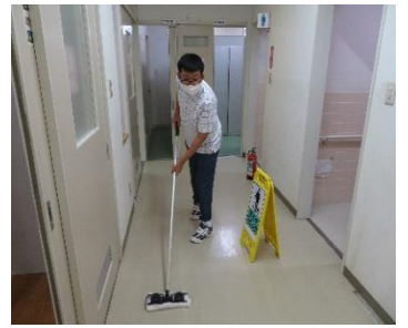
ゆか そうきん ようす 床の雑巾かけの様子