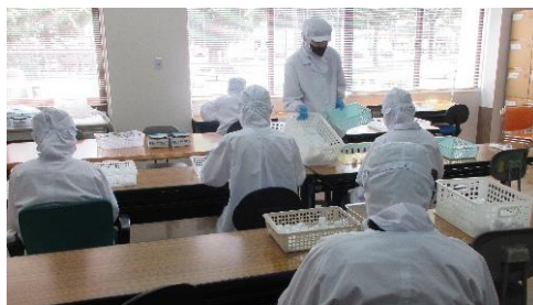
けいりょう こんぼう 計量コップの梱包