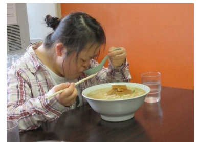
ま 待ってました、いただきます