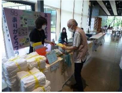
となりの工房のものだけど、黄色のタオルが欲しかったんだ