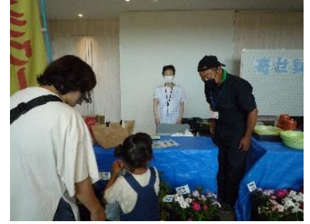
キレイな日々草はいかがですか