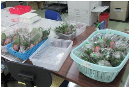
おおば ふくろづ 大葉の袋詰め

がつか か か もくてきべつがいしゆつぎょうじ しゃかいふくしほうじん みょうこう けんがく 6月4日(火)、目的別外出行事で社会福祉法人ほっと妙高ワークセンターを見学しまし た。28人の利用者が参加。参加者は、他の事業所がどんな作業をしているかに興味深々。 おおば ふくろづ けいりょう こんぼう み むかし こうぼう おおば 大葉の袋詰めや計量コップの梱包を見て、「昔、さくら工房でもやってた。」「大葉のい い匂いがする。」と感想を述べ、センターの職員に、「これは何のキャップですか。」「この さぎょう むずか せつきよくてき しつもん 作業は難しいですか。」と積極的に質問。 ちゅうしょく みょうこうし まつちやや すき ほう た 昼食は、妙高市の松茶屋で、ワンタンメンとみそラーメンの好きな方を食べました。 おい き だいまんぞく 「美味しい。」「また来たい。」と大満足。