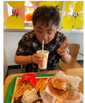
じぶん えら 自分で選んだマックセット。