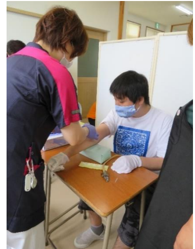
さいけつがんば 採血頑張りました。

こんご たいちようかんり おこな げんき す 今後も体調管理を行い、元気に過ごしましょう。