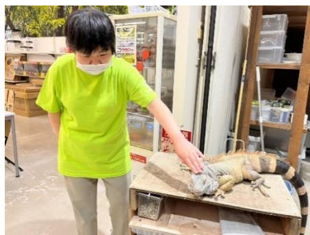
「イグアナ可愛いね。」