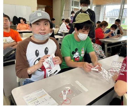
かみひこうきづく たの 紙飛行機作り楽しかったよ。