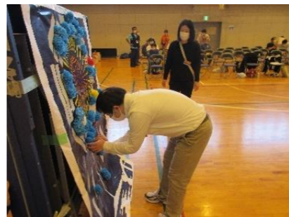
今年は花火を咲かすぞ

昼食は、『ほっともっと』のカットステーキ重とサラダを食べました。ボリュームのあるお肉に、「腹いっぱいだわ」と、大満足。