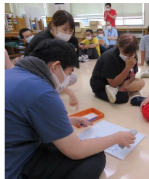
イントロクイズ 当たるといいな