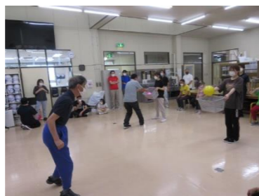
フリースローゲーム 狙いを定めて「えい」