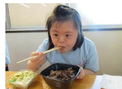
お肉がジューシー