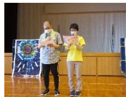
息のあった閉会宣言