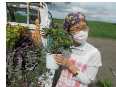
ひとついかがですか