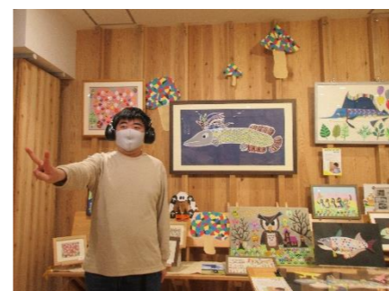
作家の長田さん 色彩豊かな作品ばかり

その後、保護者会からいただいた1人2,000円のクオカードで、ローソン上越土橋店で か 買い物訓練。クオカードの使用も回数を重ねる度に上達しました。欲しい物を買って、 み 満ち溢れたみんなの笑顔。