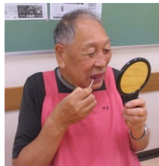
鏡を見ながら染出し