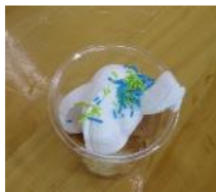
おやつは、北さくら工場のシフォンを使ったデコレーションパフェ