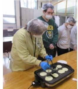
上手く、ひっくり返れ

チャレンジデーは、『自ら経験、挑戦することを通して、経験値を増やすこと』が目的。今年は、ホットプレートで焼いた生地を、ヘラでひっくり返すことに挑戦しました。また、あんこの盛り付けも経験。あんこが苦手な人は、生クリームやジャムを盛り付けるなど、好みのどら焼きを完成させました。出来立てのどら焼きの美味しさは格別。「作ることも楽しかったし、どら焼きもおいしかった。もっと食べたい。」と、皆さんからいかにも嬉しそうな感想が聞かれました。