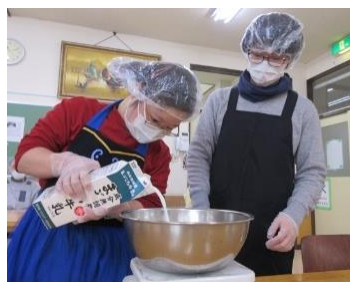
決まった量をよく見てゆっくり