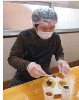
あんこは、たっぷりのせるとおいしい