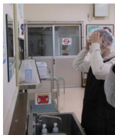
髪の毛が混入しないよう しっかりネットを被る

調理当日は、衛生管理をお怠ると食中毒や異物混入の危険があるため、鏡を見て身支度を整えました。計量係と攪拌係に分かれて慎重に作業。衛生的でおいしい食事を作るために気をつけなくてはならないポイントは何かを、学びました。