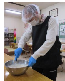
混ぜるのは、意外と大変だな