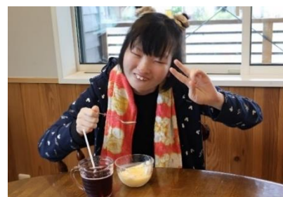
ぶどうジュースを選びました。おいしい！