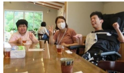
ひざしが差し込む素敵な店内でした