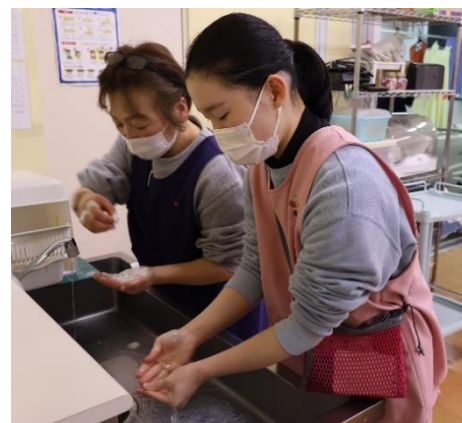
指の間、爪、手首も念入りに

2月14日(金)手洗い訓練を実施。手洗いは感染予防の基本中の基本。動画を視聴し、正しい手洗いの重要性を再確認しました。マニュアル通りに洗っているかを、職員同士でチェック。今後も基本を忘れずに感染対策に努めます。