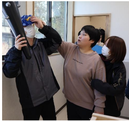
鬼は外に行きなさい