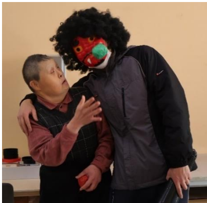
もしかして職員さんですか?

2月3日(月)、「鬼が来たぞー」の掛け声で始まった豆まき。職員扮する鬼が登場すると、歓声や悲鳴が。利用者は鬼に向かって「鬼は外!」、「福は内!」、と言いながら、豆(ボール)を投げ、果敢に立ち向かって鬼を退治しました。「職員と思う鬼に豆を投げるのは、ちょっと…」と、優しい声がありました。